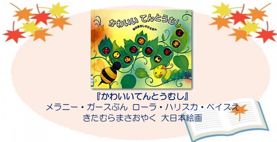
『かわいいてんとうむし』 メラニー・ガースぶん ローラ・ハリスカ・ベイス きたむらまさおやく 大日本絵画