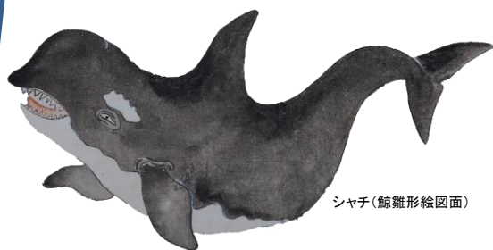
シャチ(鯨)形絵図面