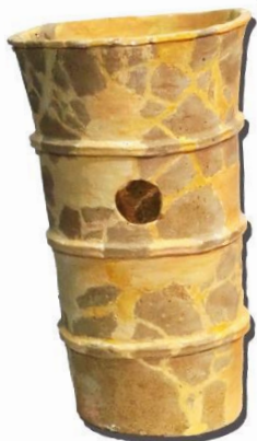
離湖古墳円筒埴輪