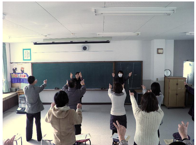
(昨年度伊根中学校で実施された親のための応援塾の様子)

京都府丹後教育局では「子どもたちを包み込むはぐくみの環境づくり」に向け、情報提供を目的とした社会教育広報紙「丹後はぐくみネットワーク通信」を発行します。