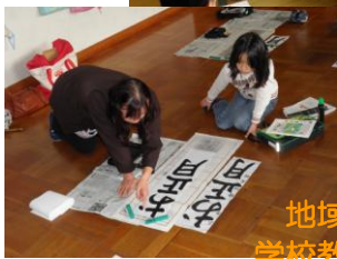
地域で支える 学校教育推進事業