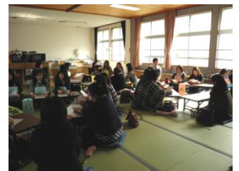
親のための応援塾