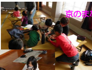
京のまなび教室推進事業