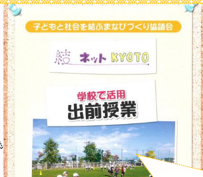
子どもと社会を結ぶまなびづくり協議会

今年度の丹後PTA指導者研修会では「いのちを考える教室」を実施します。子どもたちを被害者にも加害者にもしないために大人にできることは何かを考えていきます。