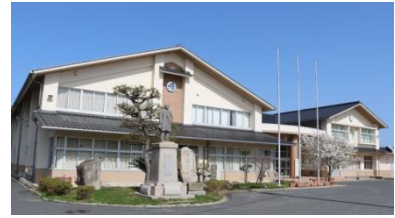
丹後学園 京丹後市立丹後小学校