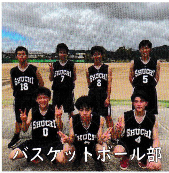
バスケットボール部