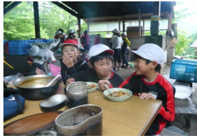
5月29日(水)~31日(金) 【5年生移動教室】