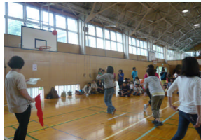
6月9日(日) 【PTAシューティングゲーム】