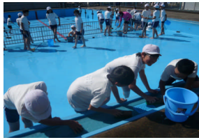
6月3日(月) 【5・6年プール掃除】