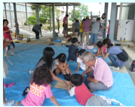
6月15日(土) 【土曜ひろば②】