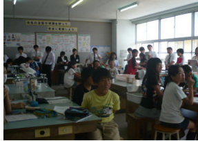
6月4日(火) 【中丹フレッシュセミナー】