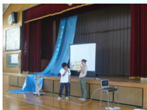
6月13日(木) 【全校震災学習】