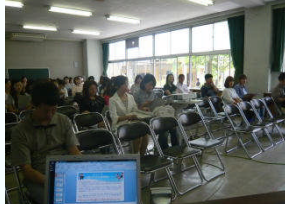
6月6日(木) 【学校見学会】 【親のための応援塾】