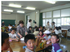
6月14日(金) 【地域の方とのクラブ活動】