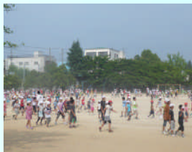
5月28日(火)~ 【元気に走ろう】

6月は、祝日のない充実した日々で、多くの行事がありました。地域やPTAの行事もありました。1年~4年生は、生活科や総合学習で校外学習にも出かけました。百聞は一見に如かずですが、百見は一体験に如かずかも…です。