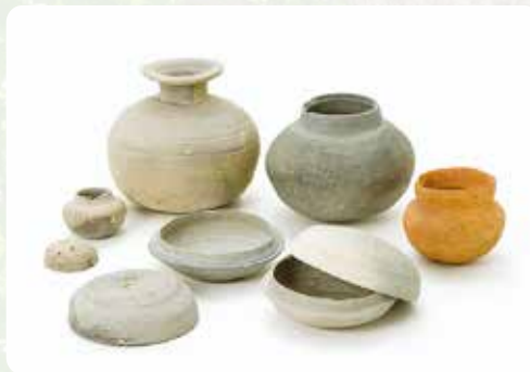
東光寺古墳出土土器