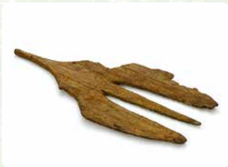
瓦谷遺跡出土又鋏