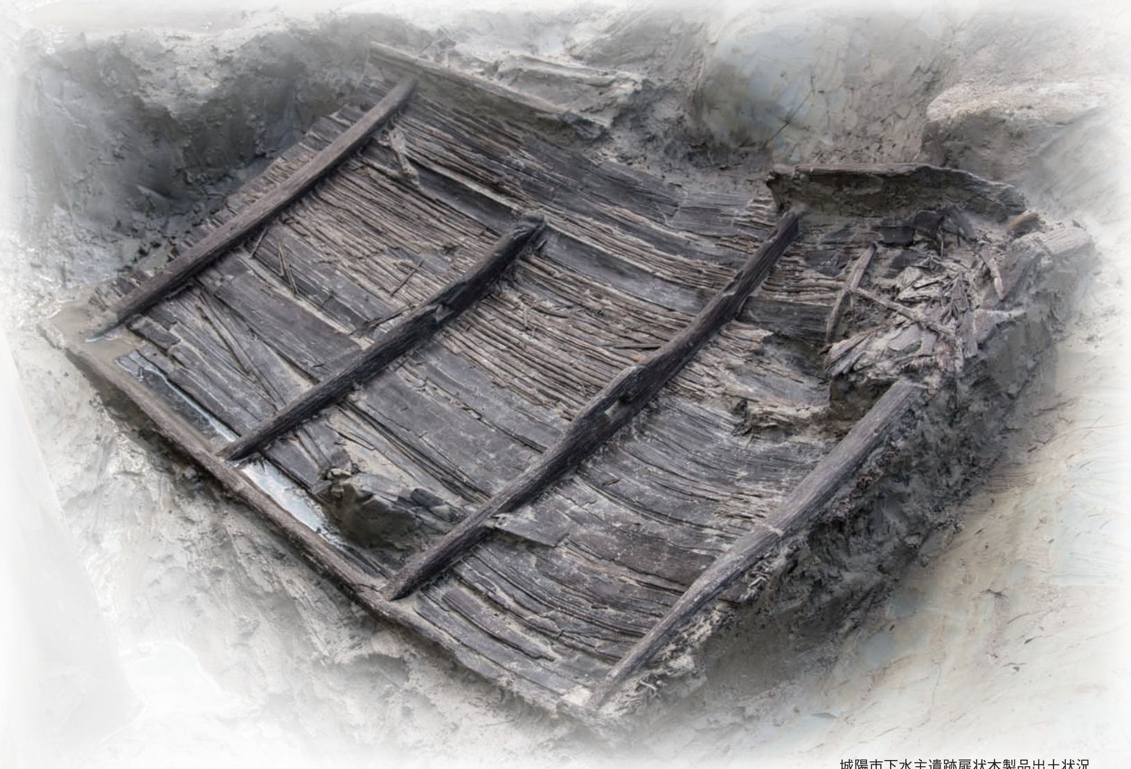
城陽市下水主遺跡扉状木製品出土状況