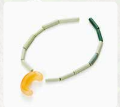
芝山遺跡出土玉類