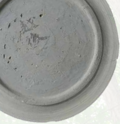
岡田国遺跡出土墨書土器

この展覧会では、速報展示として、平成 28 年度に京都府内で実施された発掘調査の成果を出土した遺物や写真パネルで紹介します。