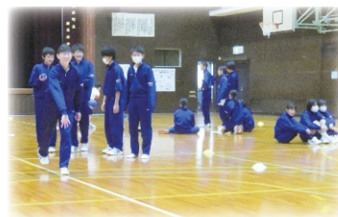
▲ボッチャ体験の様子(精華南中学校)

府内には、ボッチャなどの体験を通して、「障害の社会モデル」について学習している学校もあります。「障害の社会モデル」とは、障害（バリア）は、障害のある人ではなく社会が作り出しているという考え方で、その社会の障害（バリア）を取り除くことが必要です。そのためには、パラリンピックのように、一人一人の違いを理解し、違いに応じて工夫することが大切ですね。