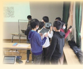
▲福知山公立大学との連携 「2次元コードを使ったクイズ作成」

令和3年度の指定校では、京都教育大学や福知山公立大学、近畿職業能力開発大学校京都校と連携して、ICT活用やプログラミング教育、学習評価、児童生徒の支援の在り方などについて研究や教材開発を行うほか、小学校での教科担任制の導入に向けての研究も行っています。