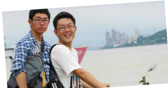
台北のパワースポットで1枚

国際性を伸ばすためには、様々な経験を積むことが大切です。海外研修の経験は、自らの視野を広げ、国際的な視点を身につけるだけでなく、改めて日本を見つめ直す機会になります。