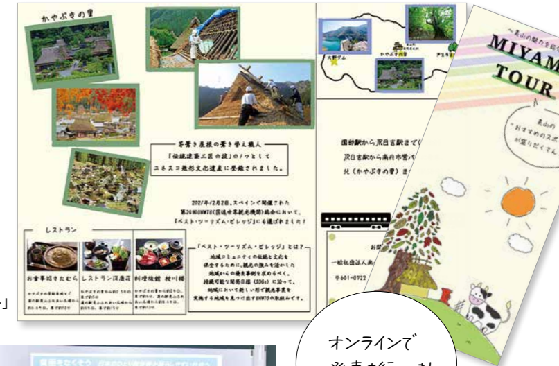
作成した「美山紹介パンフレット」

本校は京都府教育委員会が進める府立高校特色化事業「グローバルネットワーク京都」の指定校になっています。探究学習で身に付けた力を活かし、ポスターセッションや英語プレゼンテーション、論文作成に取り組んで、他校の高校生と交流します。