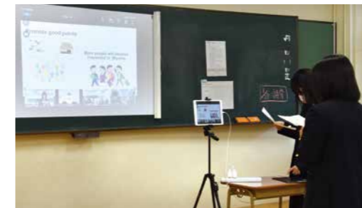
美山町活性化について英語でプレゼンテーションを行いました。