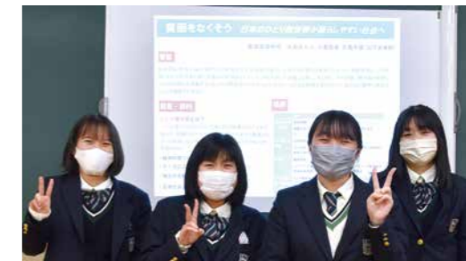
「貧困をなくそう」をテーマにポスター発表をしました。