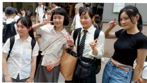
現地の生徒と一緒にフィールドワーク！