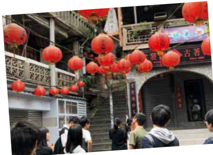
台湾の文化を体験