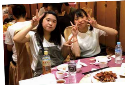
まわるテーブルで美味しい食事