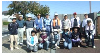
グリーンプランにご参加下さった皆様