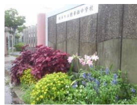
裏門前花壇は花でいっぱい ←チューリップ球根植えつけ作業