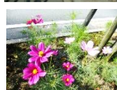
正門前歩道コスモス