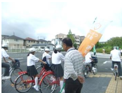
旗を持って…月初のあいさつ運動

7月8日、3校の登下校見守りボランティアの皆様を対象に講習会を開催しました。木津警察署交通課の方に来て頂き、自転車の交通ルール、登下校安全指導のポイントを教えてくださいました。また後半の交流会ではボランティアの皆様おひとりずつに熱い思いを語って頂き、保護者の方からは「本当に多くの方々に見守られていることを知った。感謝します。」との声が聞かれました。今後このような交流の機会を設けたいと思います。