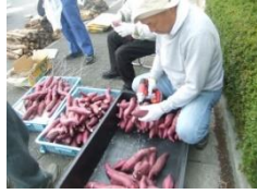
芋焼き器の中はこんな様子→

11月7日、ほかほかまつりが行われました。朝7時から30名もの地域の方にお集まりいただき、PTA役員の方と一緒に全校児童分の焼き芋を焼いていただきました。1本ずつドリルで穴をあけ、針金をとおし、ドラム缶でつくった芋焼き器の中に吊るして焼きます。焼けた芋は冷めないように粗殻の中に入れて、クラスごとに数えて箱詰めします。朝から楽しみにしていた子どもたちは、甘〜く焼けたさつまいもに大喜び。来年もご協力どうぞよろしくお願いたします。