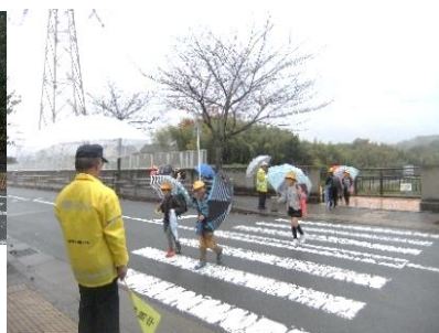
雨の日もありがとうございます