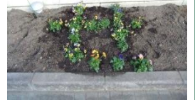
読めるかな？「せいかだい」の「せ」の文字