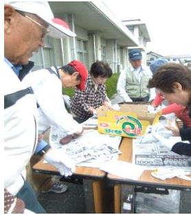
数を間違えないように箱詰めします