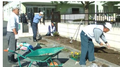
正門前花壇の植え替え作業。パンジーを「せいかだい」の文字の形に植えて下さいました。

1年生のさつまいも掘りのお手伝い。菜園ボランティアの皆様、いつもありがとうございます