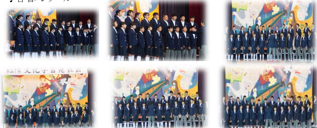
すばらしい歌声が体育館いっぱいに響き渡りました♪

5月に行われた航空写真撮影から始まった創立30周年記念の取組や行事も、この日で最終となりました。文化学習発表会も同時に開催され、精華南中学校の歴史と文化を堪能できる、まさに「記念日」にふさわしい一日となりました。