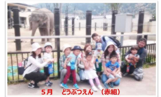
5月 どうぶつえん(赤組)