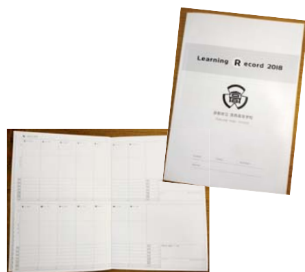
学習記録冊子 (LR: ラーニングレコード)

大阪国税局 神戸地方検察庁 京都府（初級） 京都府警 防衛大学校 陸上自衛隊 (株)ウエダ ジャトコ (株)サンコール (株) 鉄道リネンサービス (株)