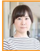
絹本 桂 数学 食べ物文化研究会 ソフトテニス部 「為せば成る」