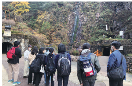
サイエンスツアー 「生野銀山・人と自然の博物館見学」