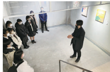
サタデープロジェクト 「アートホテル探訪」