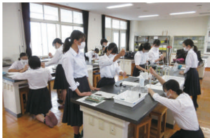
サイエンスチャレンジ 「マジックケミストリー」