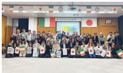
アイルランドとの国際交流