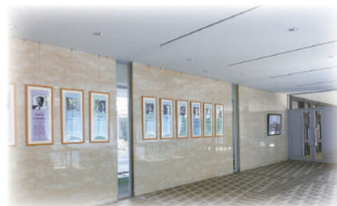
洛北高校のオープンスペースには 各界で活躍する先輩たちの写真が掲げられています