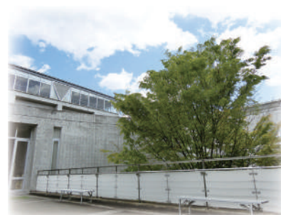
校舎と体育館をつなぐブリッジテラス