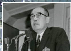
湯川 秀樹（物理学者） ノーベル物理学賞 （1949年）