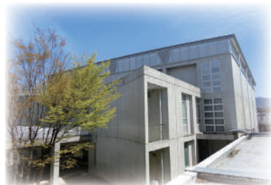
通気性がよく機能的な体育館