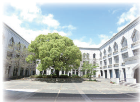
洛北高校の歴史を見守るクスノキ