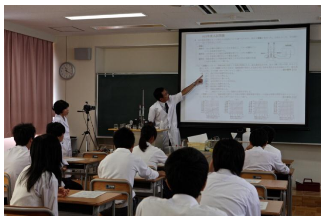
【ICT機器を駆使した理科の授業】

1年生、2年生の生徒によるパネルディスカッションでは、「乙訓高校の志望動機」、「授業、部活動などの学校生活の様子」、「将来の夢」等、高校生の生の声を聞き、大変好評でした。