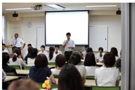
【生徒による パネルディスカッション】