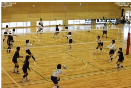
【部活動体験】 バレーボール部