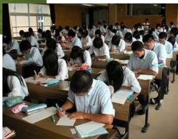
キ リ ト リ 線