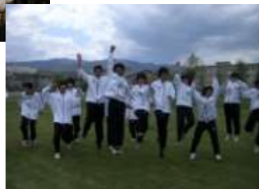
キ リ ト リ 線