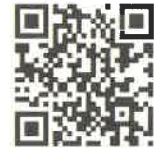
応募フォーム アクセスQRコード