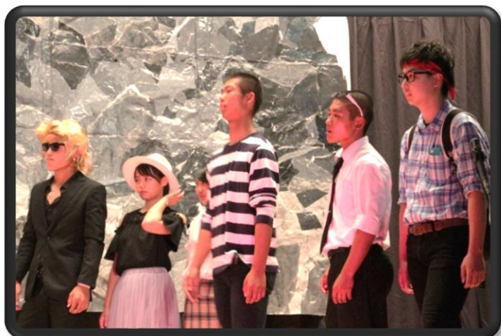
1組「冬のキリギリスたちへ」