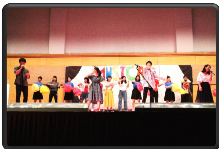
3組「HIGH SCHOOL MUSICAL」