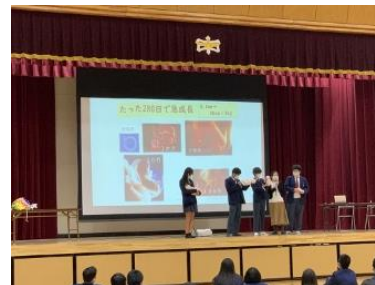
助産師が行く！ いのちの出前講座