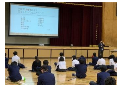
LGBT 性の多様性について