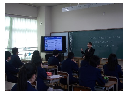
《環境教育出前授業の様子》