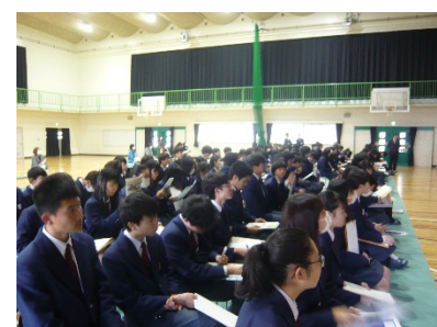
《進路学習会の様子》

当日は、専修学校を代表して近畿情報高等専修学校、私立高校を代表して大谷高校、公立高校を代表して地元の京都八幡高校から先生をお招きし、それぞれの教育内容や特色、進学に当たっての心構えなどについてお話ししていただきました。この進路学習会を通して、進路実現への意識・意欲を高め、規律ある学校生活を過ごしてほしいと思います。保護者の方も、是非、お子様の進路について、今からいろいろなお話をしていただければと思います。