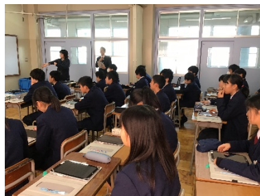
《情報モラル出前授業の様子》

また、2月12日（水）には『消費者教育の出前授業』を行いました。講師に八幡市生活情報センターから2名の消費者生活相談員の方に来ていただき、若者が巻き込まれることの多い消費者トラブルを通して、より良い消費生活を行うための手法を教えてくださいました。