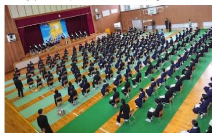
12月の立会演説会の様子