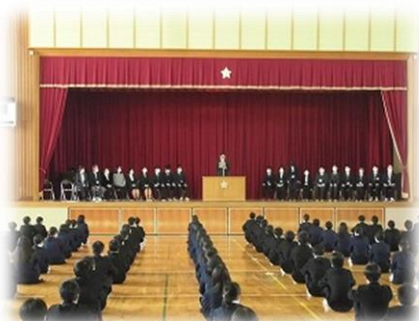
4/7 (火) 大宮中：着任式