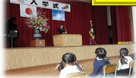
4/7 (火) 大宮第一小