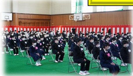
4/8 (水) 大宮中

○1年生 69名 (男35・女34) ○全校児童 415名 (男204・女211)