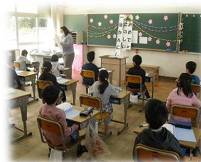
4/6 (月) 南小：学級開き