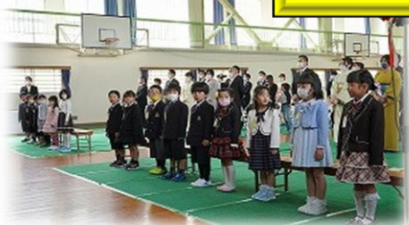
4/7 (火) 大宮南小