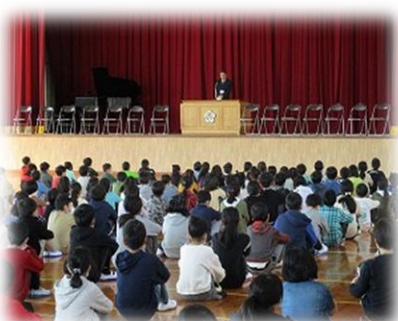
4/6 (月) 第一小：始業式