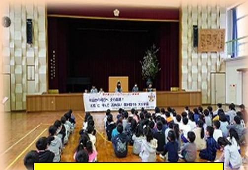
(大宮南小スローガン提起)

「今日から明日へ」・・・【大宮中学生徒会】 「全力前進！」・・・【第一小児童会】 「学んで 高め合い」・・・【南小児童会】 「挑み続ける」・・・【大宮中学生徒会】 「“とも”に」・・・『友』・『共』・『智』 から得る学び 「大宮学園」・・・ふるさと・学園