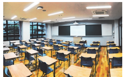
電子黒板機能付き教室