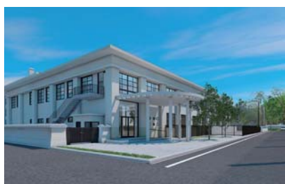
校舎北東(荒神口通)より