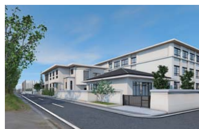
校舎南西(寺町通)より