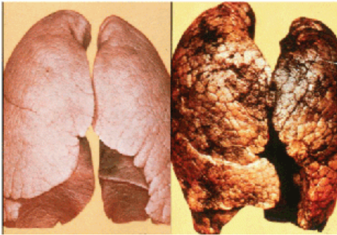
【タバコを吸わない人の肺】【タバコの煙で汚れた黒い肺】

毎日吸う人は非喫煙者(たばこを吸わない人)に比べ約4.5倍肺ガンにかかりやすいと言われていいます。