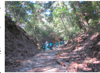
<険しい山道でした>