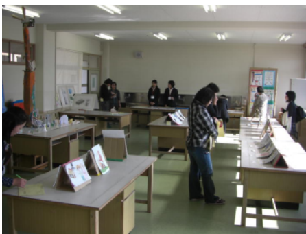
同時に美術部の展覧会も開催