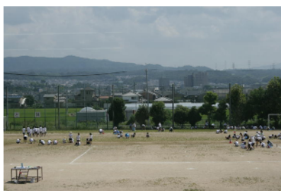
グラウンドの草抜き