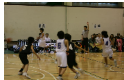
上 1点差で泣いたバスケット部男子 昨年度の秋の大会から見ると厳しい戦いになった部活やランクを上げた部もありましたが、夏の大会に向かう課題が見えた大会となりました。夏の大会は、陸上が6月5日、球技等は7月17日～19日となっています。あと2ヶ月あまりもう一度、「心と体」の基礎・基本に戻ってチーム一丸となっていきたいものです。