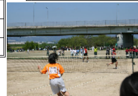
上 個人優勝の女子ソフトテニスペア 昨年度の秋の大会から見ると厳しい戦いになった部活やランクを上げた部もありましたが、夏の大会に向かう課題が見えた大会となりました。夏の大会は、陸上が6月5日、球技等は7月17日～19日となっています。あと2ヶ月あまりもう一度、「心と体」の基礎・基本に戻ってチーム一丸となっていきたいものです。

各会場で熱い戦いが行われ、特に、2日目は絶好の天気になった大会でした。各部活では冬の練習の成果をみる大会として、善戦をしました。