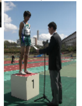
陸上個人優勝者の表彰

各会場で熱い戦いが行われ、特に、2日目は絶好の天気になった大会でした。各部活では冬の練習の成果をみる大会として、善戦をしました。