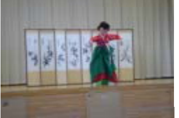
【韓国の古典舞踊を鑑賞】

2月12日、総合的な学習の時間(NT学習)である「国際理解学習」が1学年で行われ、135人が『韓流』の時を過ごしました。異文化交流を通して、国際感覚を養うと共に日本の伝統文化を再認識するもので、平成14年度からは、姉妹都市交流にちなんで韓国をテーマに体験学習を続けています。この日は、一部は、学年全体で韓国の古典舞踊と音楽鑑賞を行いました。二部は、各テーマを選択してそれぞれの体験を行いました。