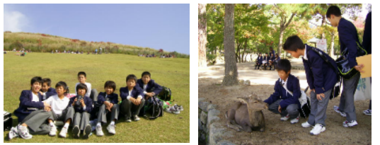
若草山にて 鹿に興味津々

「城陽市から五里の町・奈良を調べよう」という全体テーマのもとで奈良公園を班別体験学習を行いました。奈良公園内の調査活動や観光客や地域の人へのインタビュー、公園内の美化活動など多彩な活動をするなかで、古都奈良を調べました。