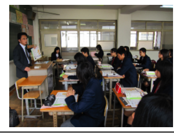
各高校の説明ブース