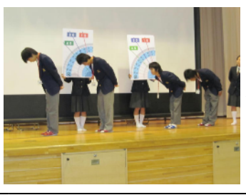
マナー講座の礼の練習