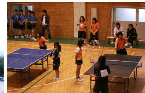
上 団体個人と完全優勝の女子卓球部 左 団体優勝の女子ソフトテニス部