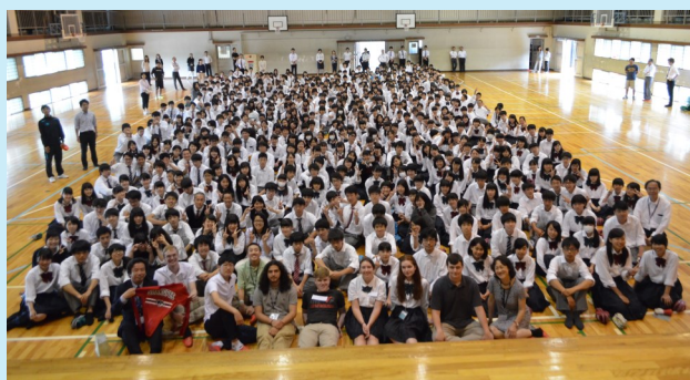
シャコピー高校の生徒たちと全校生徒で記念写真