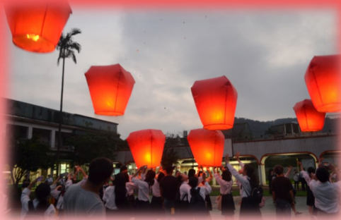
2年台湾研修旅行より