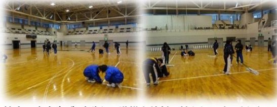
管内の中高生が、率先して準備や片付け等をしてくれました。

また、試合の間には、指導者同士も練習方法やチームづくり、ベンチワーク、各地域のバスケットボールの取組状況等についての情報交換もでき、地域や校種を越えた交流が図られました。