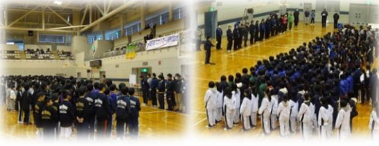
他府県市町からも、たくさんのチーム・学校が参加しました。