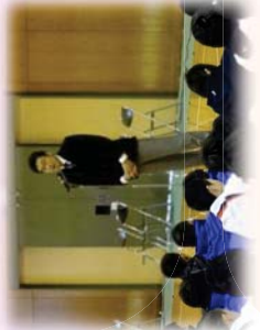
神先競技力部会長の 開会あいさつ