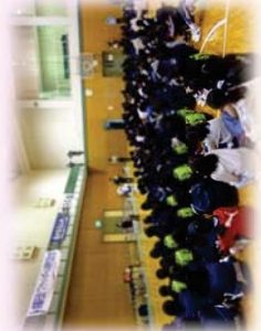
八木小学校体育館でも小学 生ミニの試合を行いました。

平成 26 年 2 月 11 日(女子)15 日(男子)の 2 日間にわたり「第 3 回京都丹波バスケットボール招待交流大会」を開催しました。