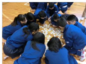
写真1年百人一首大会

福知山市教育目標 自分のために 人のために 社会のために 共に幸せを生きる人材の育成