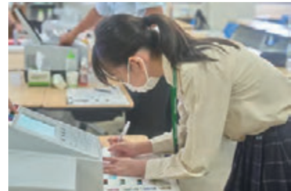
島津分析スクール

授業以外にもさまざまなイベントや取り組みを生徒に案内しています。南陽高校・附属中ならではの知的好奇心をくすぐるものがたくさんあります。