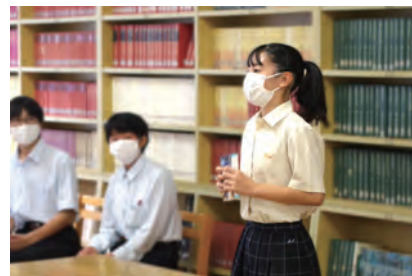
中高合同ビブリオバトルで本を紹介