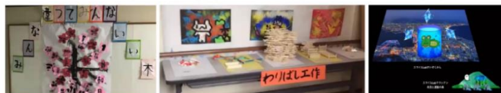
【第2回全校研修会の感想】