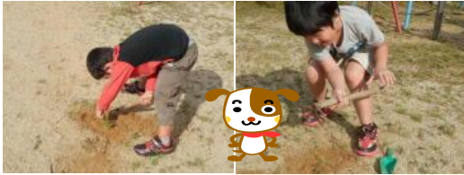
ぼくたち2人は草引きに、はまっています。

「過去最大級の台風」といわれる19号台風が近畿地方を直撃し怖い思いをしましたが、大きな被害もなく通過して行きました。台風が去った後は急に気温も下がり、日も短くなって秋の気配も一層深まってきました。子どもたちは元気いっぱい校庭やグラウンドを走り回っています。10月の放課後活動の様子をお伝えします。