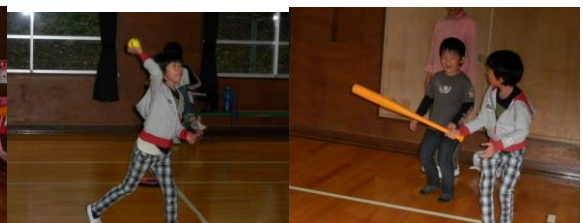
ピッチングもグッド！！