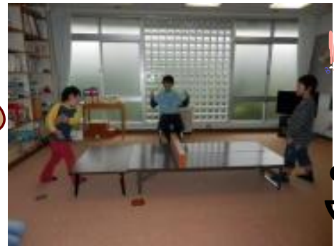
卓球の試合をしました。凄く楽しめた1番でした。見てても楽しい2人でした。