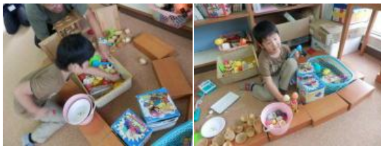
ぼくのお店です！アイスクリームもあるよ！フリスビーで遊びました！！