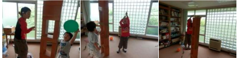
2人で協力をして木のブロックをととても高く積み上げました。