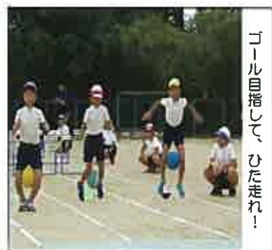
ゴール目指して、ひた走れ!