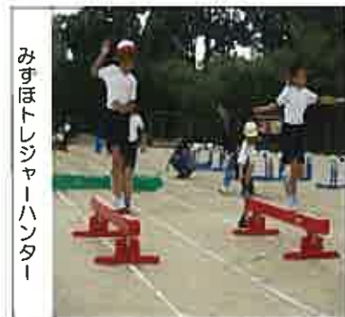
みずほトレジャーハンター