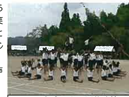
5・6年生による団体演技

空は澄み渡って晴れ、何をすることも良いさわやかな季節を迎えました。 2学期がスタートしてからの約3週間、子供たちが大きな目標にしてきた運動会が終わりました。「かがやけ！全力でかけぬけろ」という児童会全体の目標のもと、競技や演技、6年生を中心とした色別の取組に子供たちは力いっぱい頑張りました。運動会終了後の児童の笑顔や感想から、力を出し切り、真剣に取り組んだことへの満足感と充実感が伝わり、一人一人の成長を感じました。運動会を無事終えることができましたのは、保護者の皆様、地域の皆様のお力添えとあたたかい声援のおかげです。