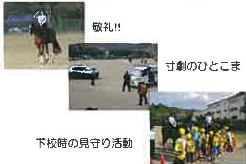
下校時の見守り活動

9月28日(木)京都府警察 平安騎馬隊のみなさんに来ていただき、交通安全について学ぶことができました。2年連続の来校となった本年度は、京都府警の方々による不審者対応に係る寸劇や号令に併せて様々な動きをする馬の演技を見ることができました。