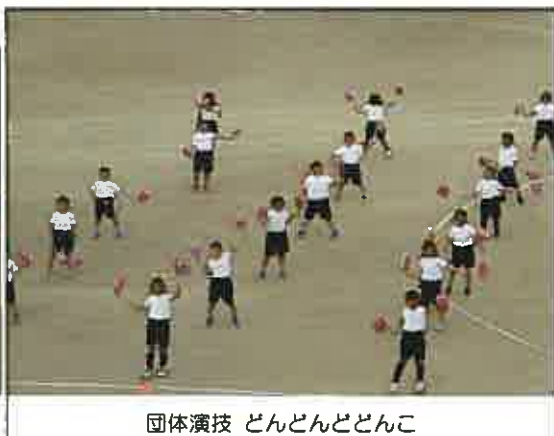
団体演技 どんとどんと