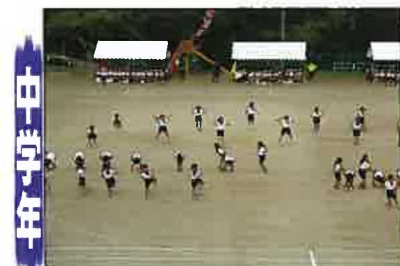
団体演技 やってみよう! みずほキッズ!