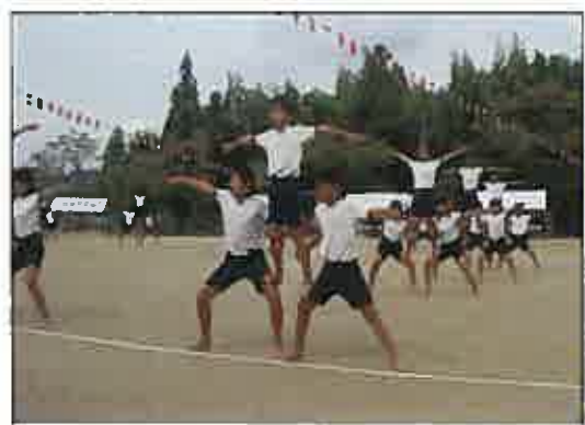
団体演技 Challenge-未来のステージを創り出せ-