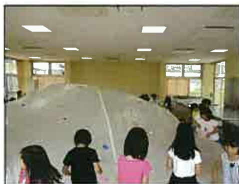
バルーンをふくらませながら描いているところ