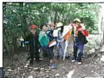
【オリエンテーリング】