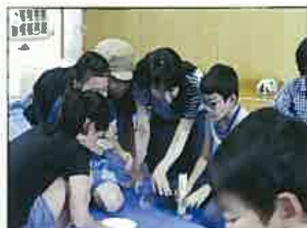
声を掛け合っの作品作り