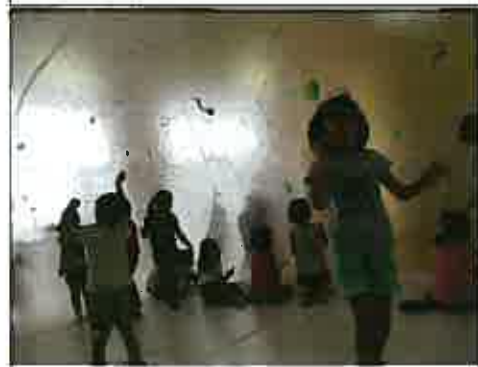
バルーンの中に入って描いているところ