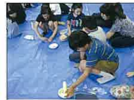
ピースを入れているところ

7月1日(土)、PTA人権委員会による「人権学習会」が行われました。本年度は、一人一人の個性やよさに気づき、友達関係や家族、そして、地域の人達との関わりをよりよくしていこうとすることをねらいとし、その象徴として自分だけのオリジナルの万華鏡作りを行いました。万華鏡が出来上がると、お互いの作品を見せ合ったり、工夫したところを交流する等、会話の輪が広がりました。人との関わり方を体験的に学ぶひとときとなりました。