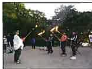
【キャンプファイヤー】