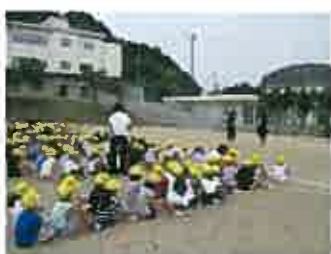
避難完了 ポイント「おさない」「はしらない」「しゃべらない」