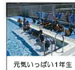
元気いっぱい1年生