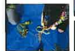
上手にできた! お家に飾りたいな。