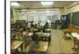
各学年の発表を教室で見ました。