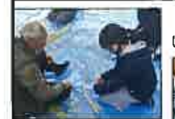
ていねいに教えていただきました。

12月11日(金)、今年度はオンラインで人権まとめ集会を行いました。人権月間のスローガン「伝えよう!言葉でつながる瑞穂の輪」のもと各学年で目標を立て取り組んできました。始めに新型コロナウイルス感染症と人権問題に関わるビデオを鑑賞し、その後学年の取組を発表しました。「『ありがとう』の言葉で自分の気持ちを伝えていこうと思った。」「他学年との交流を通して、もっと多くの人と仲良くなりたいと思った。」等、気持ちを伝え合うことで友達のことがよく考えられた人権月間でした。