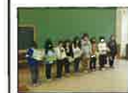
学年でまとめたことを、代表で発表しました。はっきりと伝えることができました。

12月11日(金)、今年度はオンラインで人権まとめ集会を行いました。人権月間のスローガン「伝えよう!言葉でつながる瑞穂の輪」のもと各学年で目標を立て取り組んできました。始めに新型コロナウイルス感染症と人権問題に関わるビデオを鑑賞し、その後学年の取組を発表しました。「『ありがとう』の言葉で自分の気持ちを伝えていこうと思った。」「他学年との交流を通して、もっと多くの人と仲良くなりたいと思った。」等、気持ちを伝え合うことで友達のことがよく考えられた人権月間でした。