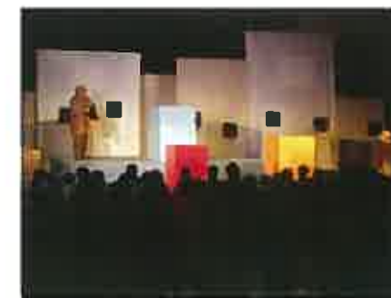
様々な箱の登場からのスタート