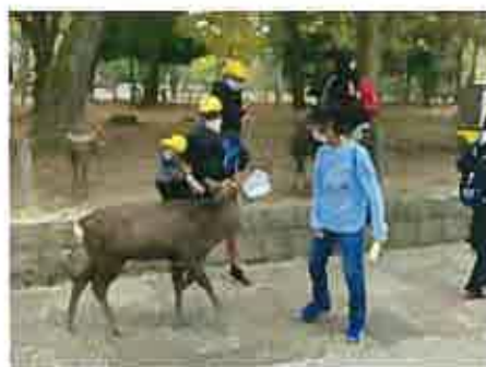
奈良公園のシカと仲良くなりました