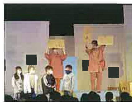
3年生による成果披露

劇団の公演は、セリフのない人形劇。人形を操る動きと音響効果により、子どもたちは引き込まれ、人形の表情やセリフを想像しながら楽しんで鑑賞していました。素晴らしい公演をありがとうございました。