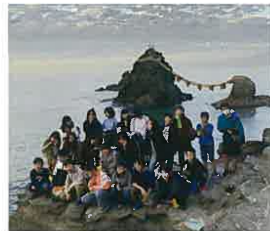
夫婦岩の前で記念写真