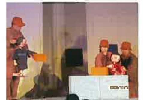
人形が本物の人に見えました