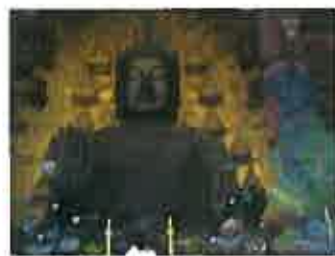
大きな大仏にびっくり