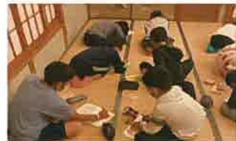
1日の振り返り「めあてはどうだった？」