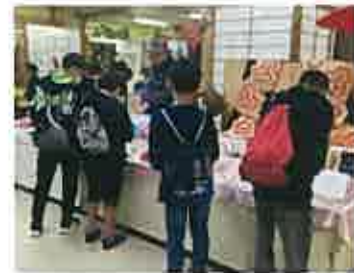
夜の買い物「何にしようかな」