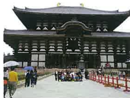
大きな大仏殿の前では小さく見えます