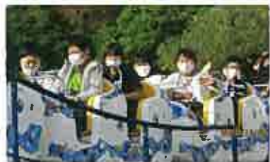
楽しい思い出ができました