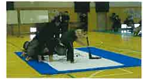
6年生書道パフォーマンスの様子