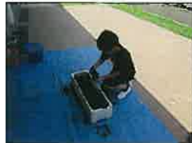
【一人ずつ植えました】

6月17日(水)3年生が地域教育協議会、栽培活動支援部の方にお世話になって、黒豆を植えました。