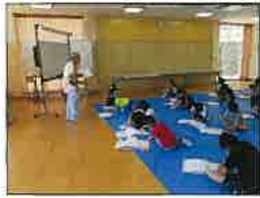
【黒豆ってどんなもの?】