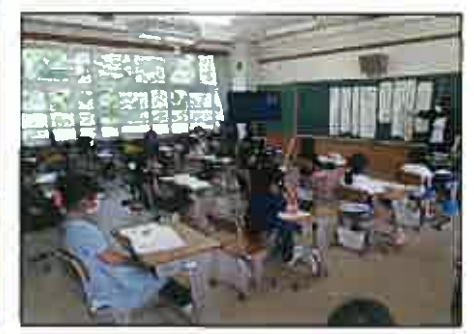
【座席の間隔を空けています】

6月1日から学校が再開し、子ども達は新しい生活様式の下、学校生活を送っています。教室では、座席の横や前後の間隔を十分とって学習しています。また、少人数でのグループ学習では横や周りの間隔をとって行うよう指導しています。下校集会は十分な間隔をとるためにグラウンドで行い、班長を先頭に両手間隔で広がって並んでいます。高学年を中心に自分たちで声をかけ合って並べる班も多くなってきました。