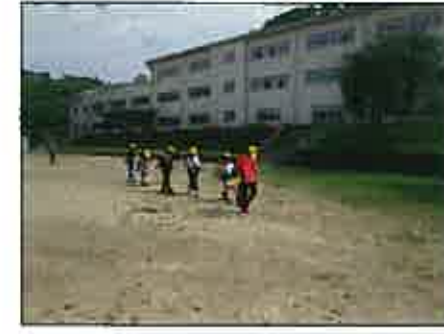
【間隔を空けて登下校】