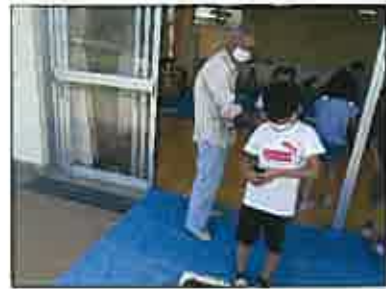
【種をじっくり観察して・・・】