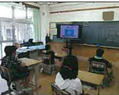
みんな真剣にお話を聞いています