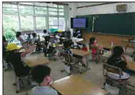
オンラインでの人権学習

瑞穂小学校のみんなが、安心して学校生活を送ることができるように、学校全体で考えていきたいと思えます。