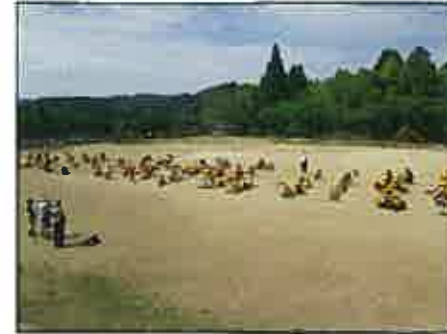
【下校集会はグラウンド】